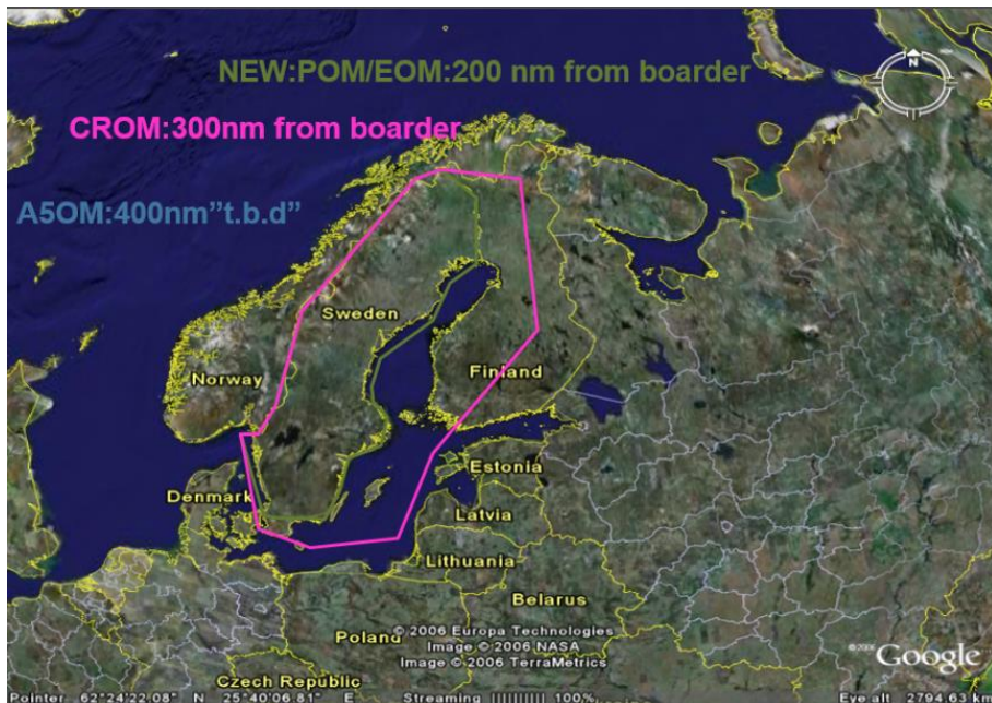
Figur 4:1a Geografisk täckning av svenskt luftläge till Norge genom ASDE

Figurerna 4:1a och 4:1b nedan visar exempel på det geografiska område som utbytet täcker över Sverige respektive Norge. Den geografiska omfattningen varierar – från 200 nautiska mil från respektive landsgräns till 400 nautiska mil från landsgränsen – beroende på krisnivå. Den gröna markeringen på kartan visar samarbetets fredstida omfattning ( Peacetime Operations Mode, POM ) medan den rosa markeringen visar samarbetets utsträckning i händelse av kris ( Crisis Response Operations Mode, CROM ). I händelse av krig ( Article 5 Operations Mode, A5OM ) ska samarbetets omfattning bestämmas ad hoc . 105